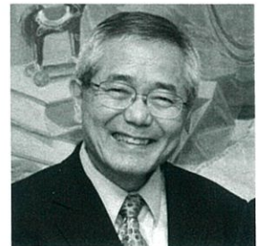
故 根岸 英一 氏 帝人久村奨学生第5回生(1957年)

そして自らの「夢」を見つけたら真理を突き詰めるまで、とことんチャレンジしてください。今後の皆さんの大いなる活躍に期待しています。